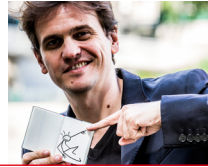
YACINE AIT KACI

Drôle, tendre et facétieux, Elyx est un personnage né de l'imagination fertile de Yacine Ait Kaci, alias Yak, et de la réflexion menée par l'artiste autour du numérique et de ses enjeux.